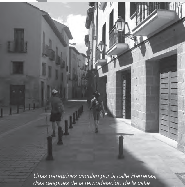
Unas peregrinas circulan por la calle Herrerías, días después de la remodelación de la calle

A mediados de septiembre, la alcaldesa de Logroño, Cuca Gamarra, visitó las calles Herrerías, Cadena y Puente, cuyas obras de remodelación acababan de finalizar después de una inversión conjunta de 197.672 euros y cuatro meses de trabajos.