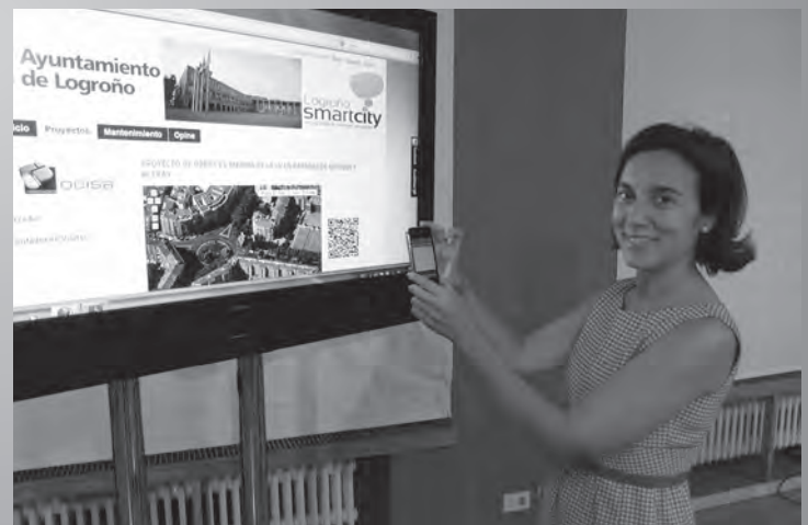
La alcaldesa tuvo la oportunidad de comprobar las prestaciones de la nueva herramienta informática

“estrenalogroño.es” inicia su recorrido con información sobre cuatro proyectos que se ejecutan en estos momentos: mejoras en paradas de autobús y aceras; ampliación del camino de San Adrián; ampliación y mejora de aceras provisionales frente a las fincas de avenida de Burgos; y remodelación de avenida de Portugal, entre Daniel Trevijano y Siervas de Jesús. Asimismo están relacionadas y con sus datos correspondientes las actuaciones de mantenimiento que en este mes se están realizando en la ciudad.