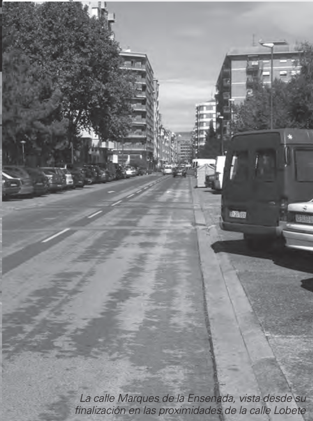
La calle Marqués de la Ensenada, vista desde su finalización en las proximidades de la calle Lobete

Hace unos años el Ayuntamiento remodeló la calle Marqués de la Ensenada , pero solo desde Avenida de la Paz hasta el cruce con Villamediana. Así, el último tramo hasta Lobete quedó sin arreglar, un proyecto pendiente que la alcaldesa Cuca Gamarra se comprometió a acometer durante su Mandato. El momento ha llegado y lo hace vinculado a los proyectos ejecutados como complemento a la integración del ferrocarril en la ciudad.