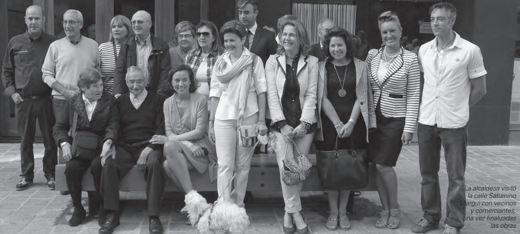
La alcaldesa visitó la calle Saturnino Ulargui con vecinos y comerciantes, una vez finalizadas las obras

Las calles de Logroño son entes vivos que se adaptan a las necesidades de los logroñeses. La fisonomía de Logroño está cambiando con grandes obras, como el soterramiento del ferrocarril y otras, de menor envergadura, pero no menos importantes. Actuaciones demandadas por los vecinos, algunas desde hace muchos años, y que siempre mejoran la ciudad