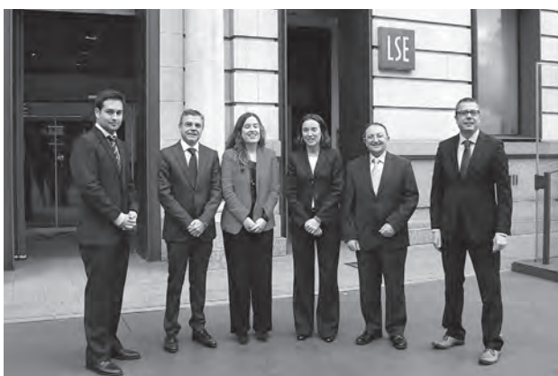
En The London School of Economics and Political Science