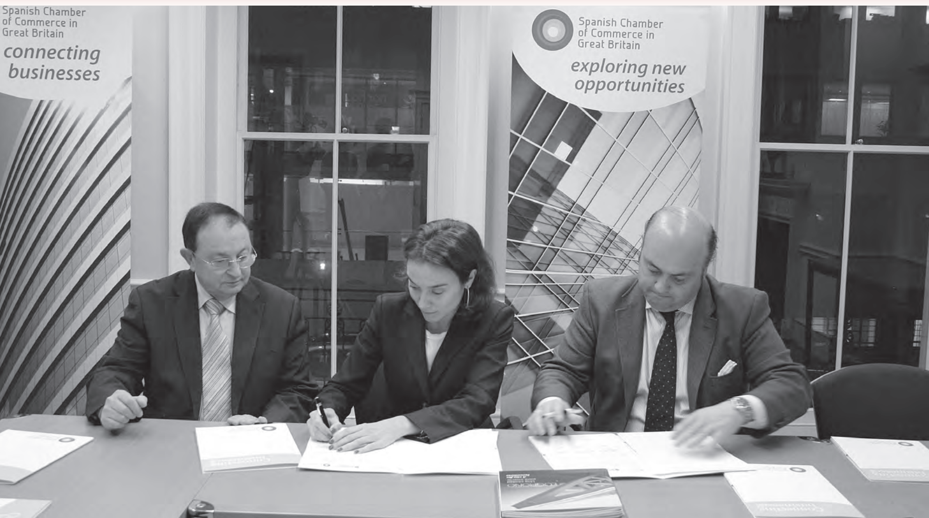
Momento de la firma del convenio de colaboración con la Cámara Oficial de Comercio de España en Gran Bretaña