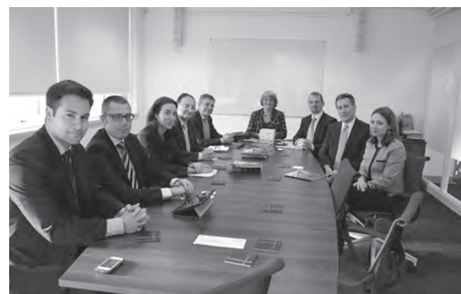
Reunión en la cámara de comercio de Thames Valley

Esta asociación de cámaras, con más de cien años de antigüedad, da cobertura a más de 2.000 empresas y es reconocida por su destacada opinión en foros empresariales, su representación de las pequeñas empresas frente a grandes organizaciones y por la cantidad de eventos que anualmente celebran en apoyo de sus asociados.