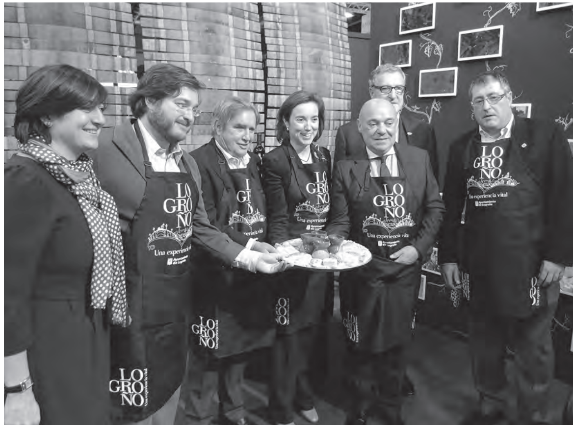
Los miembros de la Cofradía del Pez representaron en Madrid el reparto del pan, el pez y el vino de San Bernabé

Entre las citas deportivas, Gamarra destacó la XXV Copa de España de Fútbol Sala, una nueva etapa de la Vuelta Ciclista a España, la Copa de la Reina de Voleibol o el Triatlón nacional Ciudad de Logroño. “Logroño va a albergar distintos eventos deportivos y diferentes celebraciones que refuerzan nuestra política deportiva y esos valores que el deporte tiene y que Logroño comparte como filosofía de ciudad: el esfuerzo, la superación, el trabajo en equipo y el juego limpio . Es importante que federaciones y entidades a nivel nacional, como Unipublic o la Federación Española de Fútbol Sala, confíen en la ciudad de Logroño para llevar a cabo sus eventos y apoyen y respalden las posibilidades de la ciudad” .