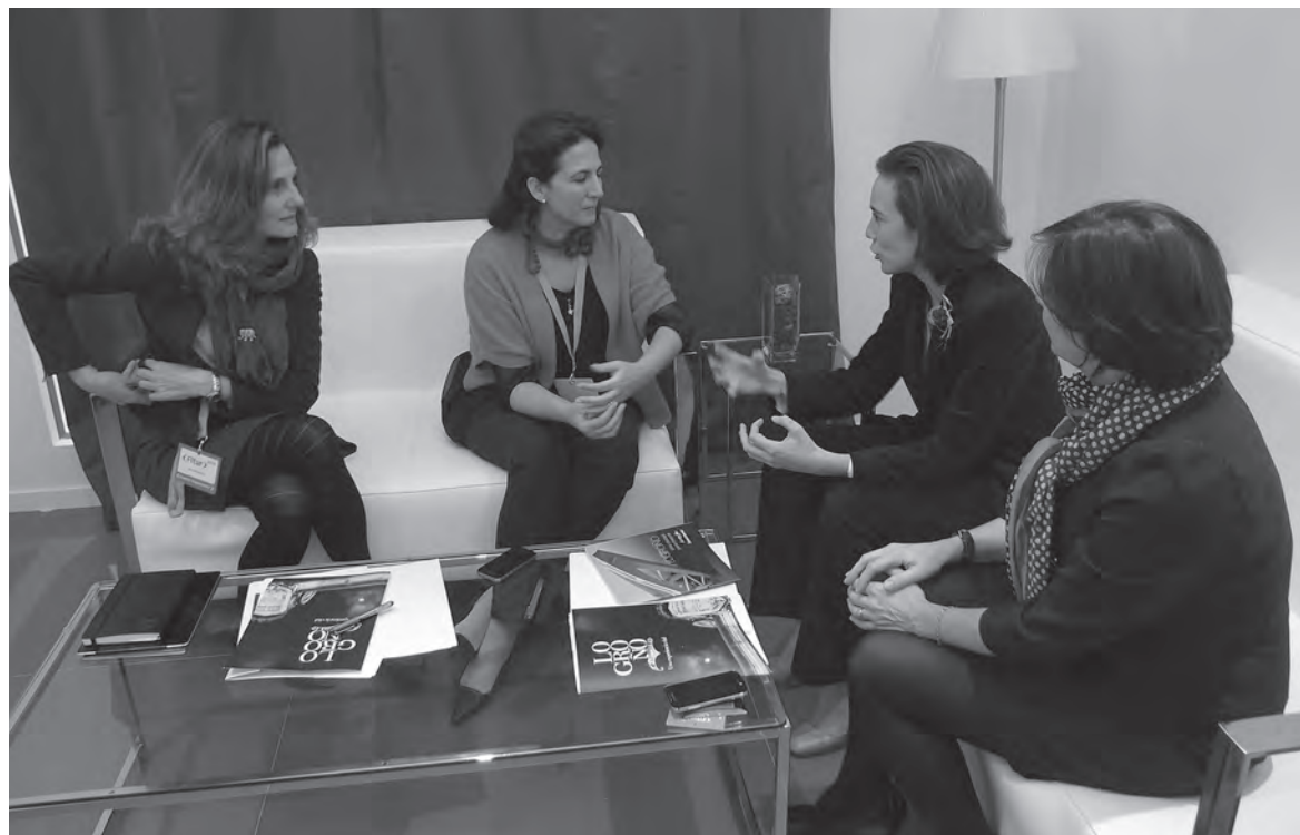
Reunión con la secretaria de Estado de Turismo en una de las salas del stand de La Rioja en Fitur