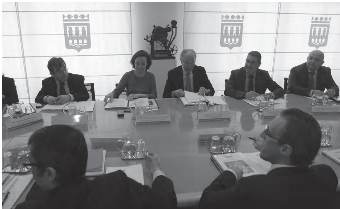
Imagen de la última reunión de la Sociedad de Integración del Ferrocarril en el Ayuntamiento

El plazo de ejecución es de un máximo de 15 meses, aunque éste será uno de los detalles que marquen la adjudicación del contrato. "Vamos a estudiar el plan de trabajo que planteen y primar aquellas propuestas que supongan las menores molestias posibles a los ciudada-