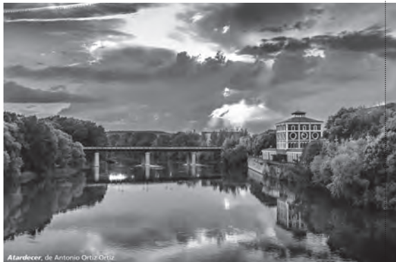
Atardecer, de Antonio Ortiz-Ortiz

La programación incluye un curso de 'Informática fácil'. Una actividad para mayores de 60 años, pero que se amplía a personas entre 40 y 60 años, que pretende iniciar en el uso de los ordenadores y en el acceso a Internet.