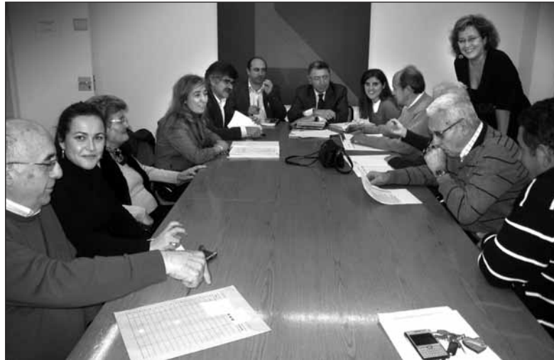
Los representantes vecinales, durante la reunión en el Ayuntamiento.

El equipo de gobierno municipal, encabezado por el alcalde, Tomás Santos, y la concejala de Participación Ciudadana, Inmaculada Sáenz, se ha reunido esta semana con representantes de la Federación de Asociaciones de Vecinos para informarles sobre los presupuestos municipales para el 2009. La principal novedad de este año es el Presupuesto Participativo, en cuya elaboración se han implicado los colectivos vecinales y otros colectivos sectoriales de la ciudad.