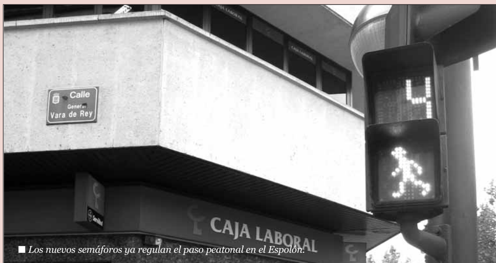
Los nuevos semáforos ya regulan el paso peatonal en el Espolón.