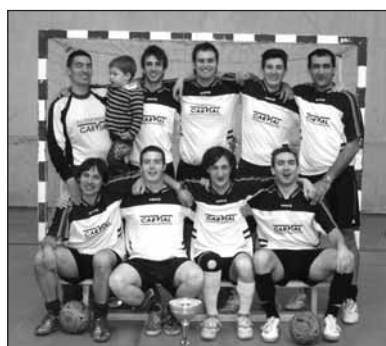
■ Carvial Aluminios, uno de los ganadores del anterior Torneo de Fútbol Sala.

Por lo que respecta al Torneo Municipal de Fútbol 8, éste nació la pasada temporada y se reedita este año. Los partidos se juegan en la Ciudad del Fútbol de Pradoviejo, y en la edición de este año participan 193 jugadores distribuidos en 16 equipos.