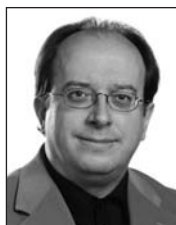
Educación y Cultura CARLOS NAVAJAS ZUBELDIA Archivo de la Ciudad