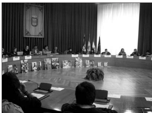
■ Imagen de la sesión de Pleno infantil celebrada esta semana.

Un grupo de alumnos de los colegios Varía y Sagrado Corazón han protagonizado esta semana una sesión de pleno infantil celebrada en el salón de plenos del Ayuntamiento. Los escolares, de edades comprendidas entre los once y los doce años, compartieron espacio con el alcalde y los concejales, y debatieron sobre 'El agua y la supervivencia infantil'.