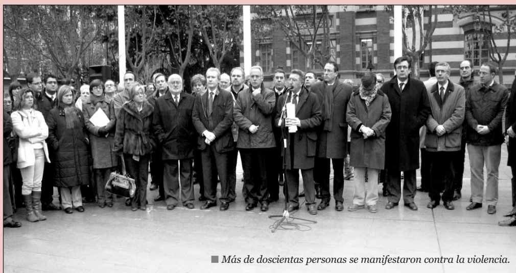
■ Más de doscientas personas se manifestaron contra la violencia.