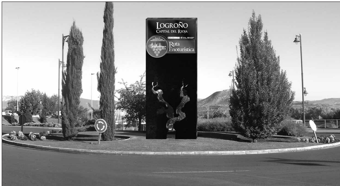
■ Recreación de cómo quedará la nueva señalítica de la ciudad.