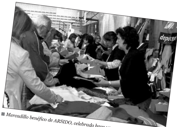
■ Mercadillo benéfico de ARSIDO, celebrado hace unas semanas.

también coordina varios proyectos educativos y formativos. Además, dispone de un equipo médico especializado en el Síndrome de Down. El pasado mes de abril, el Ayuntamiento de Logroño cedió a esta asociación un local ubicado en la plaza Martínez Flamarique. ARSIDO ya ha iniciado los trabajos de acondicionamiento de ese espacio, en el que desarrollará algunas de sus actividades.