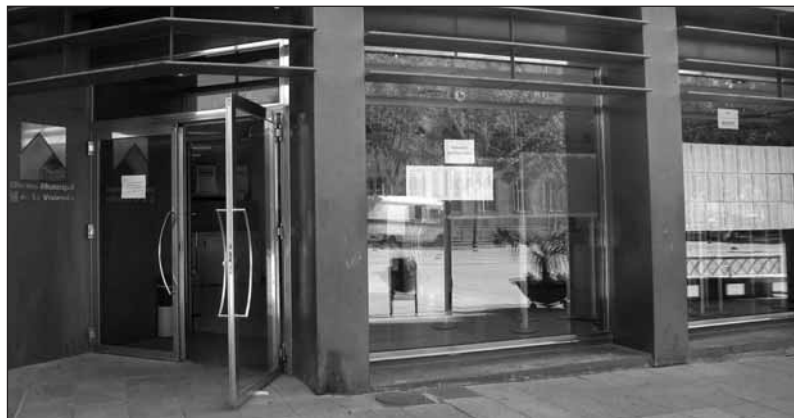
La Oficina Municipal de Vivienda, ubicada en la calle Tricio, centralizará la información sobre esta nueva iniciativa.

Se trata de un convenio marco, abierto a todas las empresas promotoras que permite que éstas puedan ofertar las viviendas en régimen de arrendamiento a precios protegidos. Dos constructoras ya han suscrito este acuerdo con el Ayuntamiento, lo que permitirá que 140 familias puedan comenzar a beneficiarse de las ventajas de esta medida.