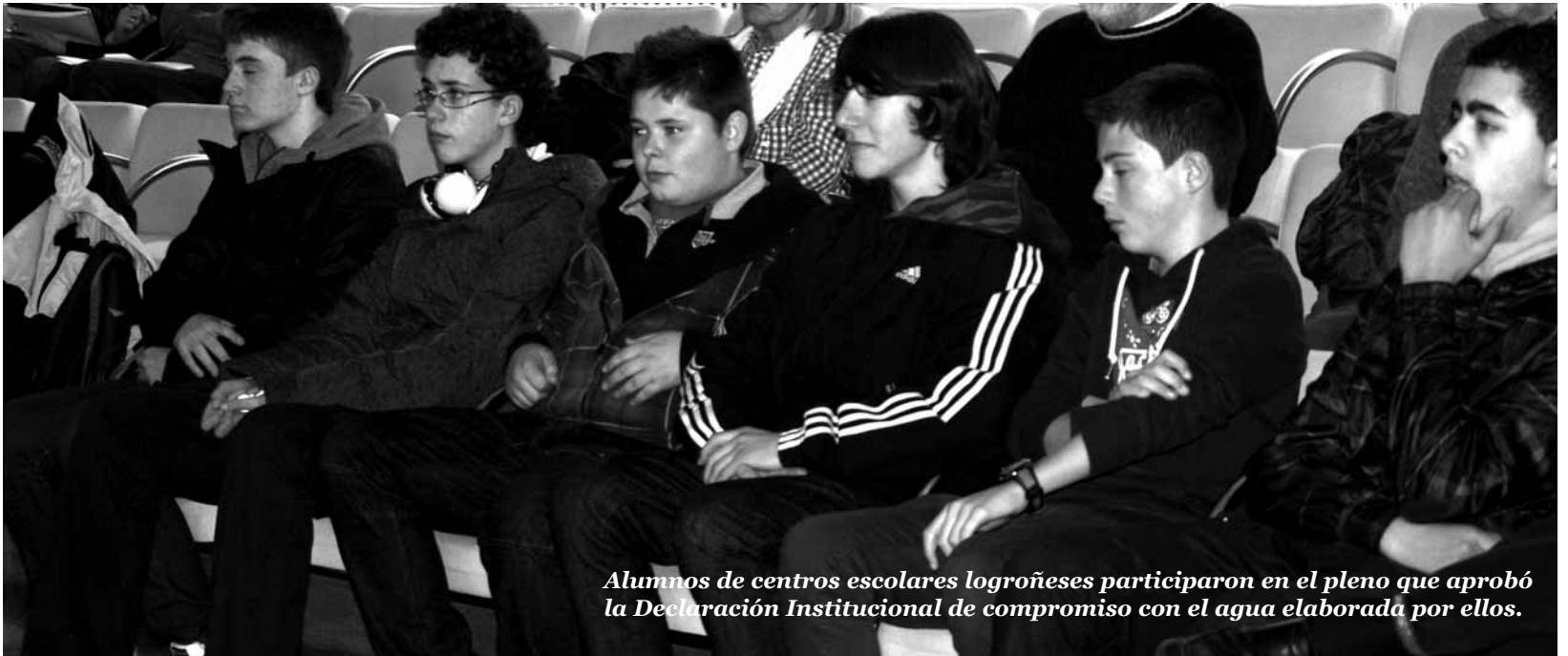
Alumnos de centros escolares logroñeses participaron en el pleno que aprobó la Declaración Institucional de compromiso con el agua elaborada por ellos.