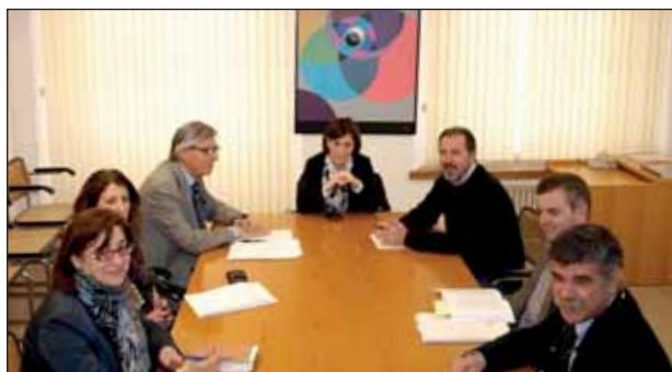
Reunión de la comisión, celebrada el pasado día 9 en el Ayuntamiento.

El grupo de trabajo, integrado por dos concejales del PSOE, dos del PP y uno del PR,