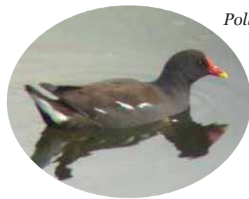
Polla de agua

El nuevo parque paseo del Pozo Cubillas da la bienvenida a los peregrinos del Camino de Santiago. Cuenta con una fuente pediluvio que refresca los pies de los caminantes y un mirador sobre el Ebro.