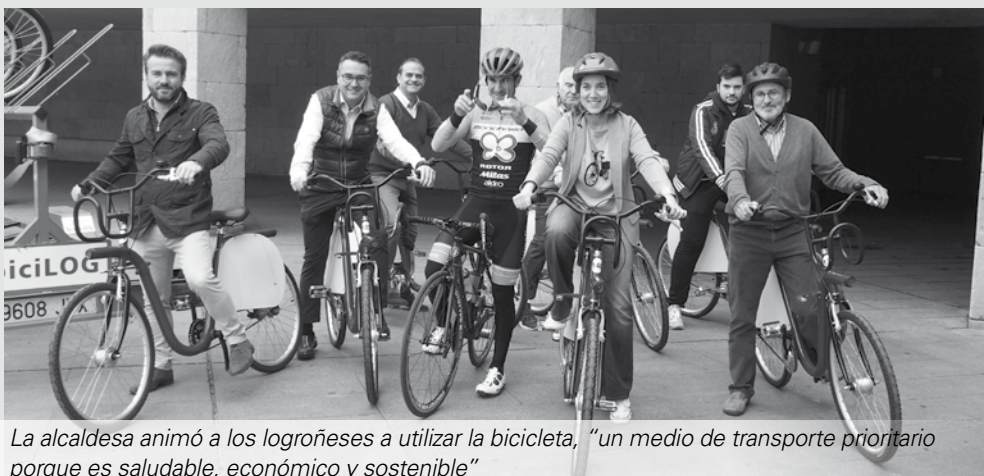
La alcaldesa animó a los logroñeses a utilizar la bicicleta, "un medio de transporte prioritario porque es saludable, económico y sostenible"