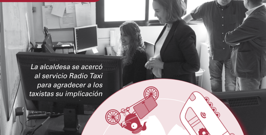
La alcaldesa se acercó al servicio Radio Taxi para agradecer a los taxistas su implicación