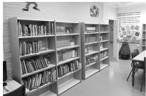
Biblioteca de un centro escolar.

Las solicitudes pueden presentarse en el Registro Electrónico del Ayuntamiento de Logroño o en cualquier registro autorizado a partir del jueves 27 y tienen de plazo 15 días hábiles.