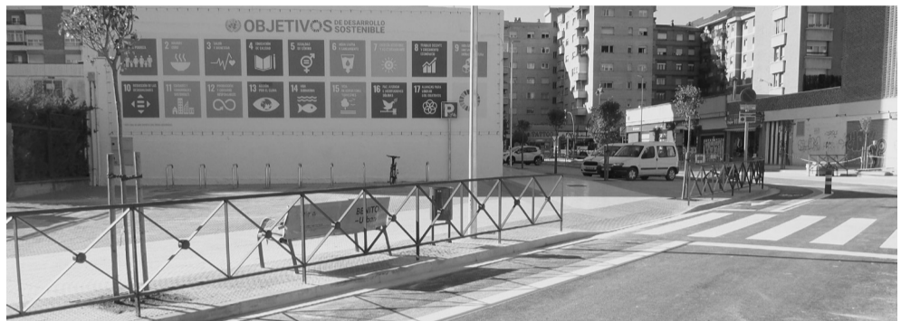
La calle Albia de Castro cuenta ahora con aceras de cinco metros.

También se han renovado el alumbrado público; la red de agua potable; el colector de aguas pluviales; la señalización horizontal y vertical de la calle; y el mobiliario urbano de la vía (papeleras, bancos y jardineras).