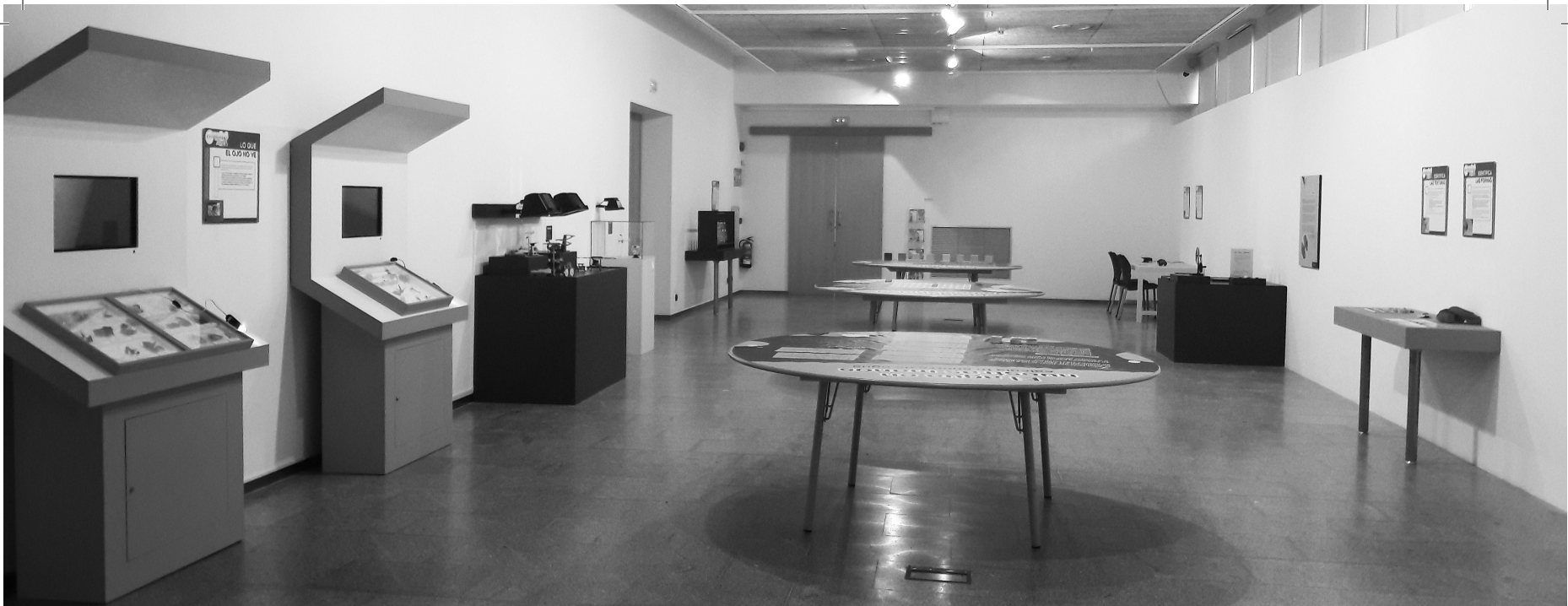
Esta muestra interactiva ofrece divertidas experiencias sensoriales.