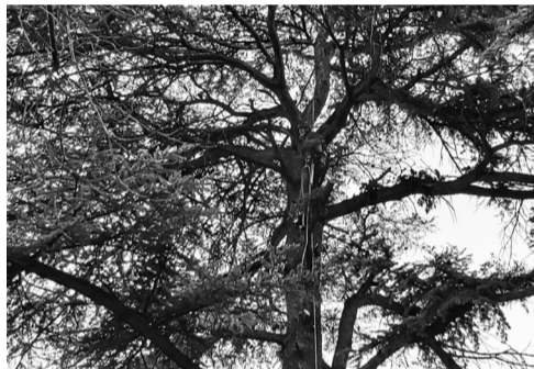
La poda en altura ha sido realizada por personal especializado.

Estos trabajos se han llevado a cabo en el Parque del Carmen, para proceder a la retirada de ramas de un cedro que el viento había dañado y presentaban un peligro para la ciudadanía. También han