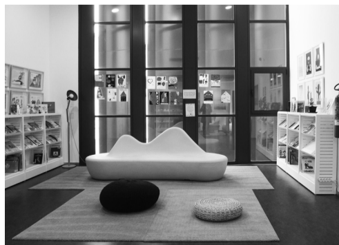
El espacio ‘Una habitación propia’ está en la Biblioteca Rafael Azcona.

‘Una habitación propia’ acogerá el sábado 30 de mayo el taller de ilustración e igualdad: ‘Mejor entre todos y todas’ , dirigido a público mayor de 12 años. Será impartido por la ilustradora riojana Raquel Marín sobre ‘El libro de los cerdos’ , de Anthony Browne .