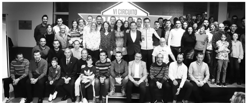
El concejal de Deportes junto con las personas premiadas en la gala.

En el Circuito de Carreras se reconoce también la constancia, la participación y no solo la marca registrada. Por este concepto, otros 51 corredores recibieron su premio.