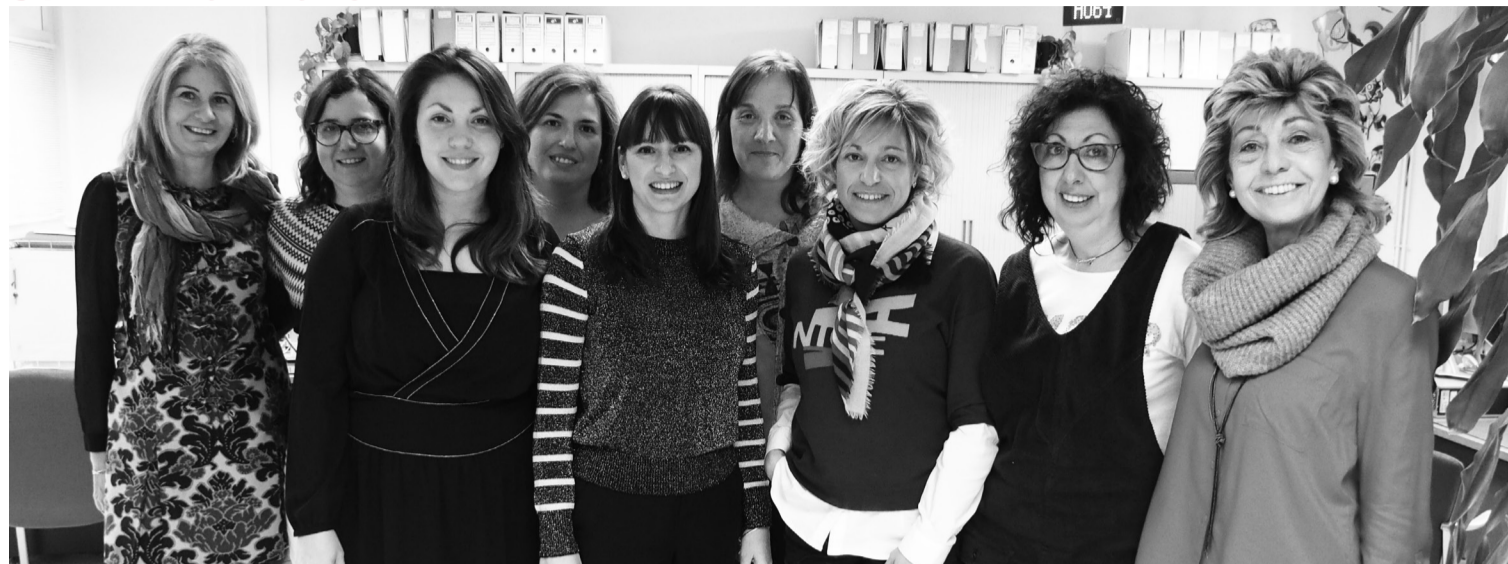
Equipo de trabajadoras de la Unidad de Estadística.