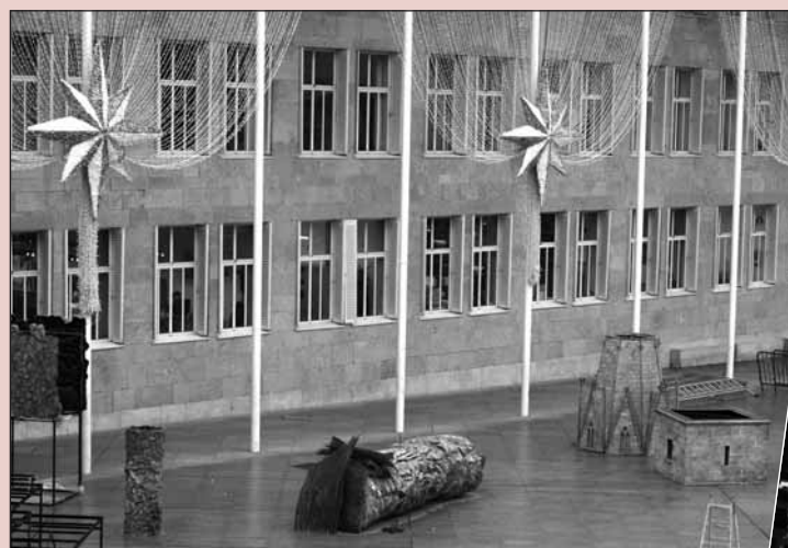
Fachada del Ayuntamiento, con las luces colocadas y primeros trabajos para instalar el belén.

El Ayuntamiento ilumina la plaza consistorial, el Espolón, la plaza del Mercado, la Glorieta del doctor Zubía y el entorno del Teatro Bretón, así como el Mercado de San Blas, la Gran Vía, a la altura del Banco de España, y en la plaza-salón. Además, algunas fuentes de Logroño estarán iluminadas con filtros de color. Por su parte, las asociaciones de comerciantes se encargan de iluminar las zonas comerciales, para lo que cuentan con una importante subvención municipal. El Ayuntamiento de Logroño se implica en esta tradición con el fin de mejorar la estética de la ciudad en la época navideña y, al mismo tiempo, incentivar el comercio de ciudad. Además, las bombillas que iluminarán