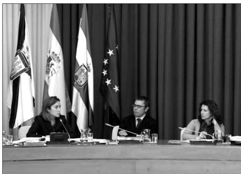
La alcaldesa de Logroño, Cuca Gamarra, intervino al final del pleno de presupuestos

políticas de austeridad nos permiten hacer más con menos, controlar el gasto y optimizar el dinero público. Hay que tener en cuenta que cada euro de que disponemos sale del bolsillo del ciudadano y hay que tenerle respeto".