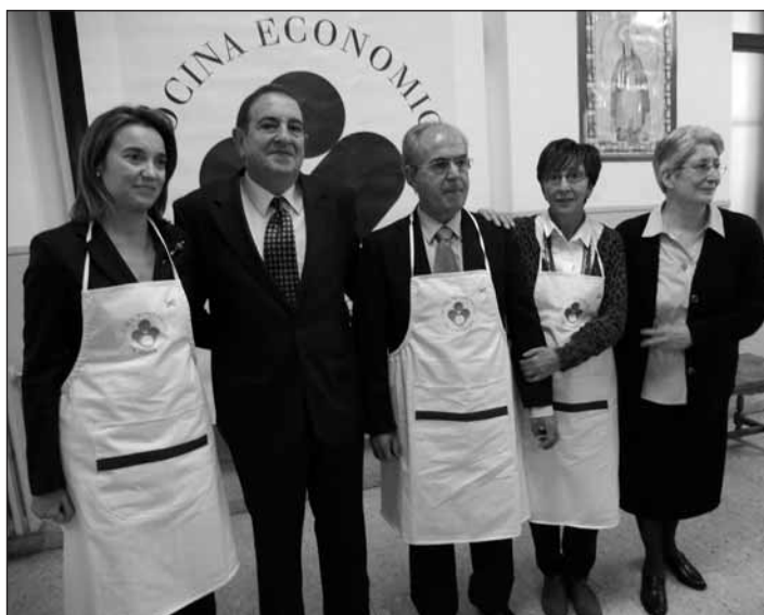
La alcaldesa de Logroño, junto a los demás premiados con el 'Delantal solidario'

La alcaldesa señaló que el reconocimiento debería ser "a la inversa" dada la importante labor que desempeña la Cocina Económica.