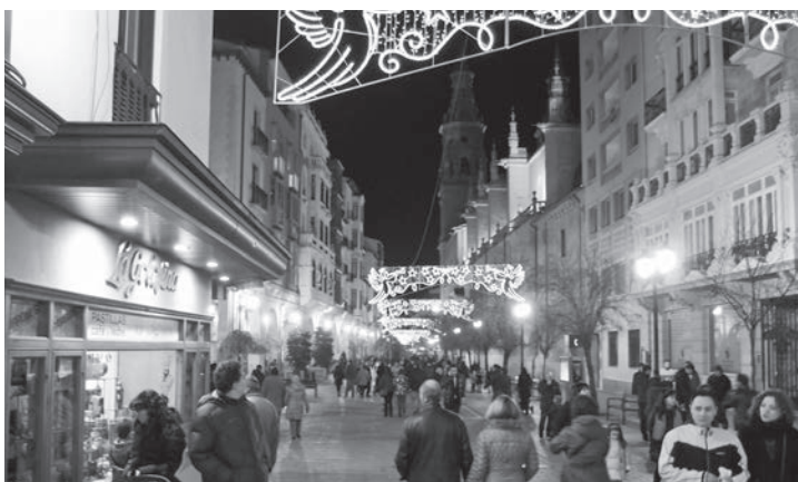
Los comerciantes de Logroño han mostrado su apoyo a la celebración de iniciativas de promoción comercial.

Logroño es Navidad. Así reza el eslogan de la campaña promovida por el Ayuntamiento de Logroño y la Cámara de Comercio para dinamizar el comercio y la vida ciudadana desde el 21 de diciembre hasta el 5 de enero. Un amplio programa de actividades (sorteos de premios en metálico, actuaciones callejeras, chocolatadas solidarias, música, talleres y el tren de la Navidad, entre otros) que promovieron la participación de unas 67.000 personas. Y otras muchas iniciativas en las que han participado numerosos colectivos y asociaciones de la ciudad para llenar de color y vida las calles de Logroño.