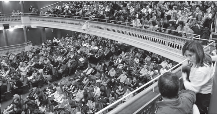
El Teatro Bretón consiguió llenar todas sus butacas en varias de las citas de Actual, tanto en proyecciones cinematográficas de gran nivel como en el concierto de Los Secretos.

Más de 16.500 personas participaron en las propuestas musicales, cinematográficas y artísticas que ofreció el festival durante cinco jornadas