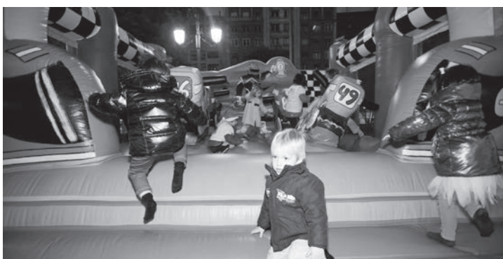
La San Silvestre batió su récord con más de cuatro mil participantes. Antes, en el Espolón, hubo actividades e hinchables para los más pequeños.