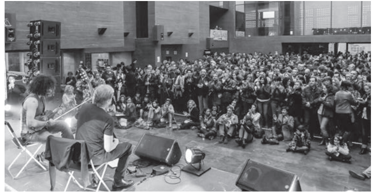
El novedoso 'Vermú torero', en el Centro de la Cultura del Rioja, ha sido uno de los aciertos de Actual Impar 2013. En la imagen, el violinista Aran Malikian.

Además, los organizadores destacaron que la nueva etapa de 'Actual' se ha caracterizado por la diversidad de escenarios y de propuestas. Nuevos espacios, como la carpa 'Actual IMPAR' para los conciertos nocturnos; o el Centro de la Cultura del Rioja, para los formatos musicales más reducidos como el Café Cantante o el novedoso 'Vermú Torero', que aunaba la actuación musical con la gastronomía y el vino.