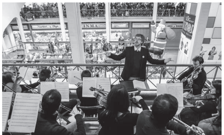
El Mercado de Abastos prodigó su faceta cultural en el certamen Actual.

Además se realizó una aplicación propia con toda la programación y el festival fue pionero en la grabación de un vídeo de 360° HD.