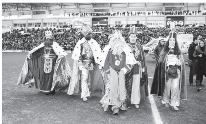
Los Reyes Magos vinieron a Logroño donde estuvieron con niños y mayores en diferentes actividades organizadas el 5 de enero.