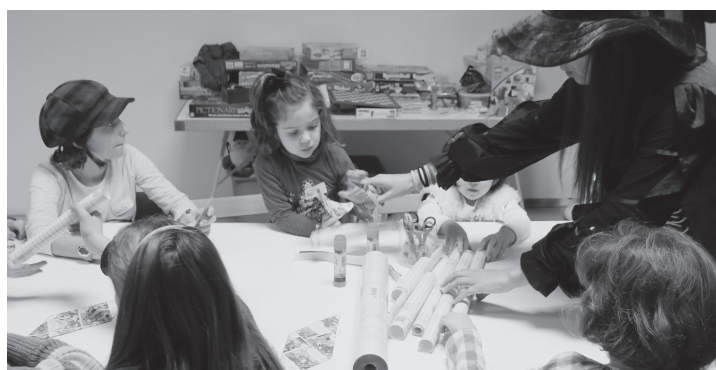
Las ludotecas han tenido un gran éxito de participación. En la imagen, la organizada en la Plaza de Abastos de Logroño.

'Logroño es Navidad' ha obtenido una excelente respuesta de los logroñeses, de todas las edades, que han participado activamente en el centenar largo de actividades distribuidas desde mediados de diciembre hasta el día de Reyes.