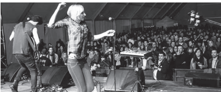
La carpa ubicada en Valbuena acogió los principales conciertos nocturnos.

En cuanto al seguimiento mediático, el festival contó con 53 periodistas y fotógrafos acreditados, de 36 medios de comunicación de toda España. Esto se tradujo en que la marca Actual, la ciudad de Logroño y las propuestas del programa ocuparon un lugar destacado en los medios de comunicación durante los primeros días de 2013.