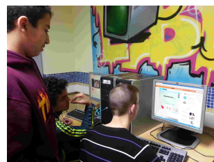
IMAGEN PARA PENSAR