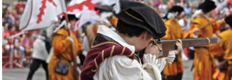
Fotografía de Lucía Lucendo, Premio Infantil del IV Concurso de Fotografía "El Sitio de Logroño"

Los logroñeses se organizan; forman una junta de defensa de la ciudad presidida por Vélez de Guevara y compuesta por seis vecinos. Los ciudadanos logroñeses, y algunos soldados castellanos refugiados en la ciudad, la defienden valerosamente y con gallardía. Es una resistencia tenaz para defender y mantener libre la ciudad al servicio del reino de Castilla.