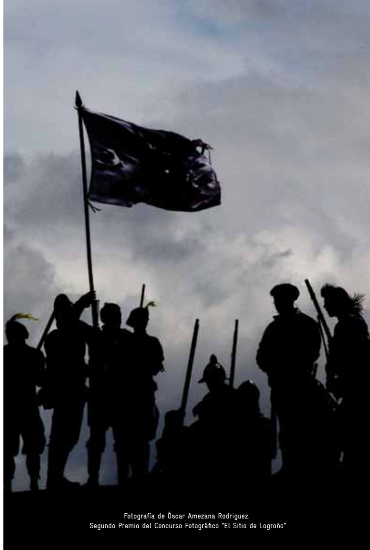
Fotografía de Óscar Amezana Rodríguez. Segundo Premio del Concurso Fotográfico "El Sitio de Logroño"