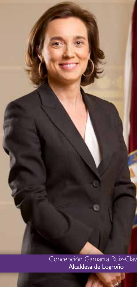
Concepción Gamarra Ruiz-Clavijo Alcaldesa de Logroño