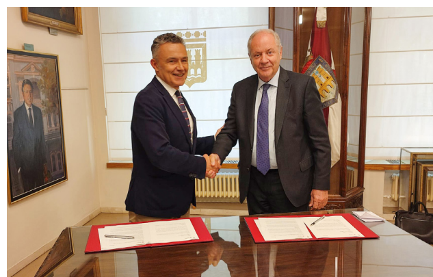
Firma del convenio entre el Ayuntamiento y la Fundación.

Además, el convenio prevé la participación en la definición de un 'Plan de cuidados de larga duración', que contemple acciones concretas en la prevención de la muerte en soledad. El Ayuntamiento de Logroño también participará activamente en el 'Observatorio de Ciudades que Cuidan' y en la 'Unidad de Gestión del Conocimiento' de la Fundación Mémora.