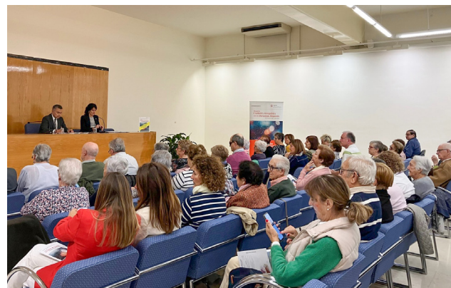
El alcalde avanzó las propuestas del plan.

Son medidas que complementarán otras como los programas de envejecimiento