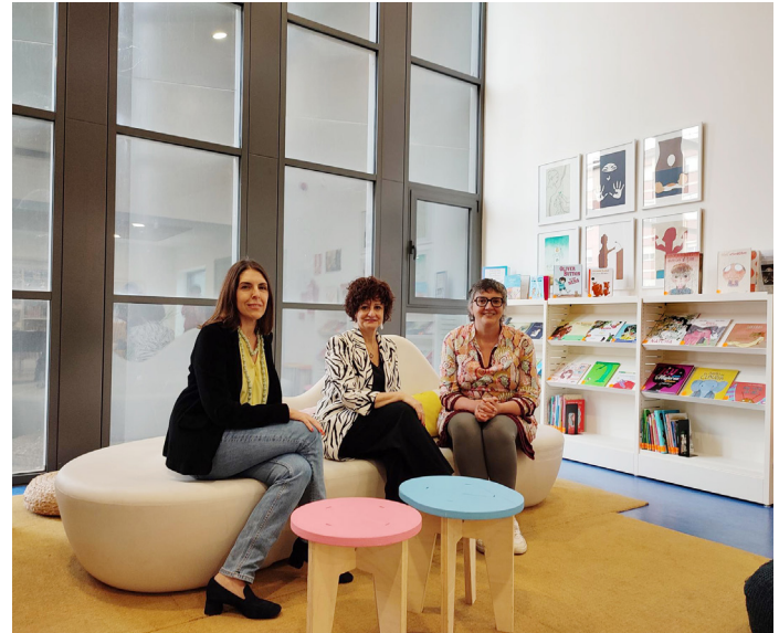
■ Las concejalas de Cultura e Igualdad junto a la directora de la Biblioteca presentaron las actividades.

Las personas que participen en estos 2 talleres tienen que llevar ropa o papeles para dibujar sobre ellos.