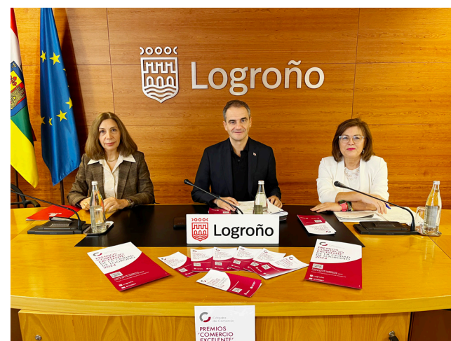
El concejal de Promoción de la ciudad en la presentación de los Premios Comercio Excelente 2024.

Los 'Premios Comercio Excelente de la Ciudad de Logroño 2024' se entregarán en una gala, que tendrá lugar el 13 de diciembre en el Espacio Lagares.