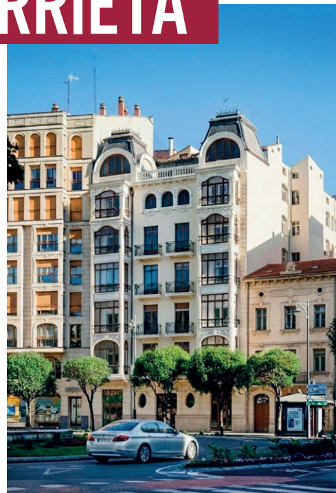
El histórico edificio 'Casa Trevijano' será un hotel.

El establecimiento se comercializará bajo la marca Eurostars y está promovido por Hoteles Murrieta S.L., integrada por Grupo Clavijo y Grupo Zeplás, con participación mayoritaria de profesionales y firmas locales en el diseño y ejecución de la obra.